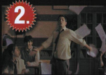
2. Reklamveren : McDonald's Reklam Ajansı : Leo Burnett