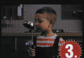
3. Reklamveren : IKEA Reklam Ajansı : TBWA\İstanbul