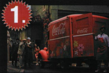
1. Reklamveren : Coca-Cola Reklam Ajansı : McCann Erickson

için hayata geçirdiği reklam filmi yer alıyor. En beğenilen kampanyalarda Siz de başarılı bulduğunuz kampanyalara oy vererek, kampanya ile ilgili düşüncelerinizi bu sayfa aracılığı ile tüm Türkiye'ye ulaştırabilirsiniz. ( www.marketingturkiye.com/yeni/Kampanyalar/YeniKampanyalar )