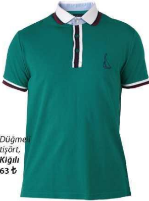
Düğmeli tişört, Kıgılı 63 ₺