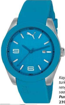
Kayışı turkuvaz rengi olan saat, Puma 239 ₺