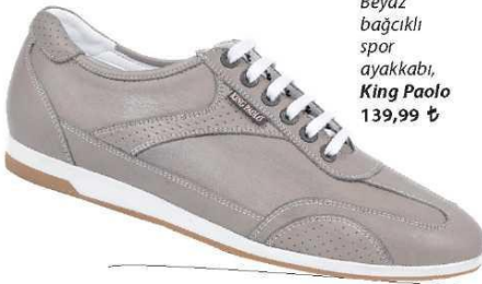
Beyaz bağcıklı spor ayakkabı, King Paolo 139,99 ₺