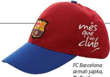
FC Barcelona armalı şapka, DeFacto 17,99 ₺